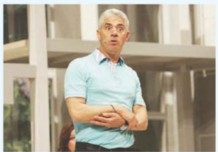
Questa sera all'anfiteatro di Altomonte, il monologo irriverente e satirico del comico Biagio Izzo, "Un italiano di Napoli" per Primafila

AD ALTOMONTE dopo lo straordinario omaggio alla cultura e alla canzone classica napoletana, dove l'arte e lo spessore di Peppe Servillo si sono amalgamati con la maestria e la visione degli archi del Solis rendendo l'evento unico nel suo genere, la XIX Stagione di "Primafila" la Ragsegna di Musica e Teatro, organizzata da "Novecento Teatri" con presidente Luisa Giannotti e direzione artistica di Benedetto Castrì, prosegue con il secondo appuntamento estivo questa sera, all'Anfiteatro di Altomonte con lo spettacolo di Biagio Izzo attore, comico, cabarettista, commediografo e conduttore televisivo, con il monologo, "Un italiano di Napoli", spettacolo divertente ed ironico all'insegna della risata contagiosa. Biagio Izzo protagonista richiestissimo nei palcoscenici televisivi nazionali,