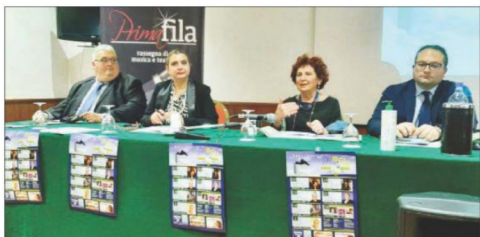
La conferenza di presentazione della Rassegna di teatro "Primafila"