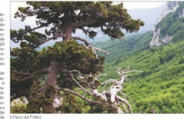
Parco del Pollino