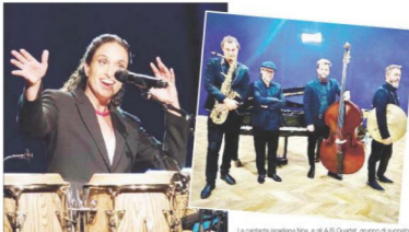
La carovana italiana Noa, e gli Ajs Quartet, gruppo di jazzisti albanesi

RUMORI Mediterraneo, il festival jazz di Roccella Jonica entra nel suo ventiduesimo anno. Si apre la seconda parte della XIX edizione, questa sera, alle 21,15, con il concerto "grande amico del festival" che ritorna dopo due anni con un progetto di musicista genovese. La prevedibilità, però, non è un tratto di carattere. Invece di tutta la sfilata del festival, le musiche balcaniche sono quelle in focus, con il jazz che si fonde in una serie di stili da un concerto registrato al Festival di Roccella Jonica in un paio di anni fa, con un concerto registrato al Festival di Roccella Jonica in un paio di anni fa, con un concerto registrato al Festival di Roccella Jonica in un paio di anni fa.